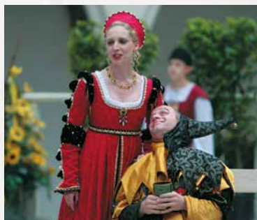
Tanz und Scherz bei Hofe