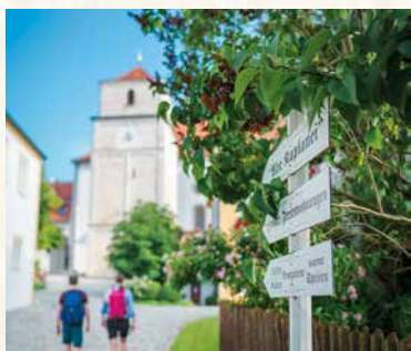
Bergen mit Münster Hl. Kreuz

In Neuburg an der Donau ist der ideale Einstieg zum 85 km langen und als „Qualitätsweg Wanderbares Deutschland“ zertifizierten Wanderweg Urdonautalsteig , der über das Wellheimer Trockental ins Altmühltal und durch das romantische Schuttertal führt und mit seinen sanften Talflanken, schroffen Felsformationen und Wacholderheiden Naturwanderer begeistert. Der Wanderweg mündet in den äußerst reizvollen, ebenfalls als Qualitätsweg ausgezeichneten Altmühltal-Panoramaweg , der für alles steht, was Wanderer lieben.