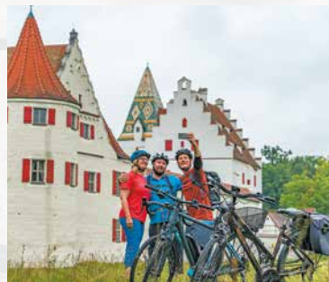
Fotostopp vor Schloss Grünau