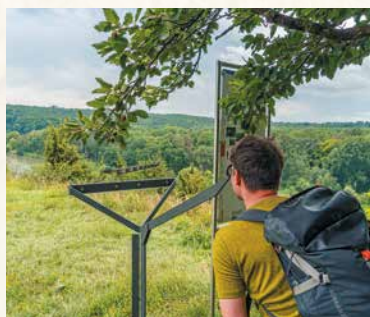
Antoniberg bei Stepperg