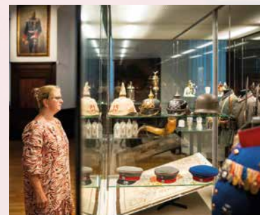
Das 15er Infanterieregiment