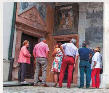
Stadtführung im Schlosshof

Haben Sie individuelle Wünsche? Aber bitte! Das Team der Tourist-Information berät Sie gerne!