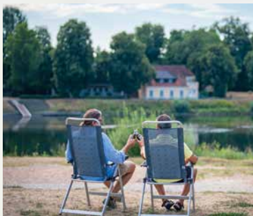
Feierabend an der Donau

Die Donau wird auch als Veranstaltungskulisse genutzt. Ob bei Europas größtem Winterschwimmen, beim Schloßfest oder beim Fischerstechen – von der einzigartigen Atmosphäre am Fluss bleibt niemand unberührt.