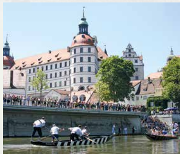
Fischerstechen auf der Donau