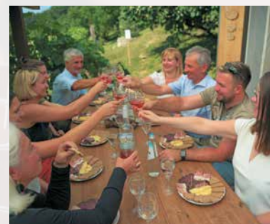
Weinprobe im Weinberg