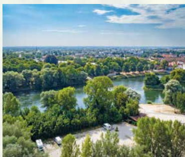
Lage an der Donau