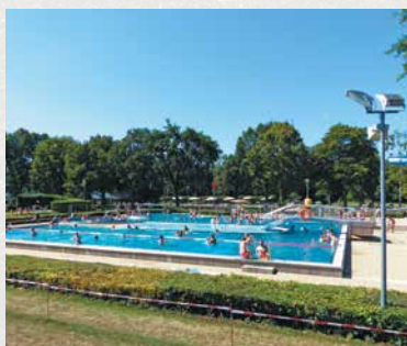
Freibad am Brandl