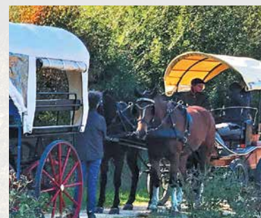
Kutschen- und Planwagenfahrten