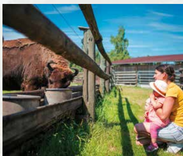
Haus im Moos

Die Lenbachstadt Schrobenhausen, weithin bekannt durch den aromatischen Schrobenhausener Spargel, ist ein gemütliches Städtchen mit einem denkmalgeschützten Altstadtensemble, das von einer historischen Stadtmauer mit Türmen und grünem Stadtwall umschlossen ist. Die Stadt bietet ein reiches Kunst- und Kulturleben mit Europäischem Spargelmuseum, Lenbachmuseum sowie kulinarischen, musikalischen und literarischen Veranstaltungen.